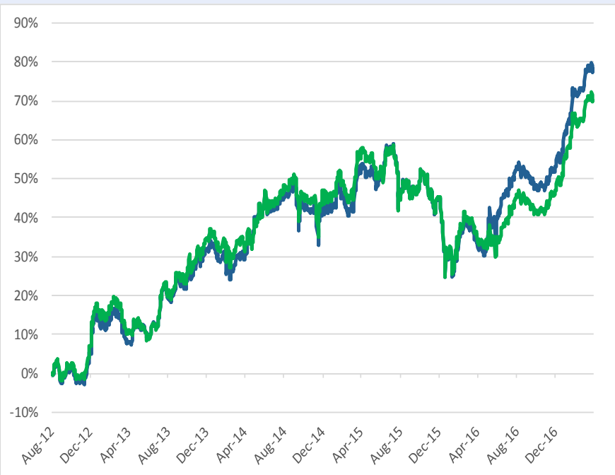
Vuan ETF BET Tradeville vs. Indicele BET de la lansare (%)